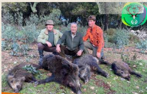
Montería en El Campillo 17 de diciembre de 2022 21 Venados, 22 Jabalíes (3 Navajeros) y 1 Muflón