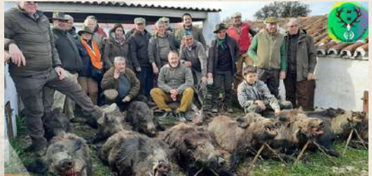
Montería en Puntal de Poniente 11 de febrero de 2022 5 Venados y 47 Jabalíes (4B y 1PL)