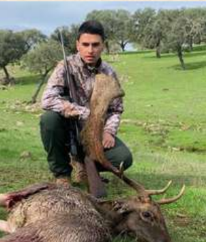
Montería en Cantillana Riberos 19 de noviembre de 2022 33 Venados, 18 Jabalies, 31 Gamos y 22 Hembras