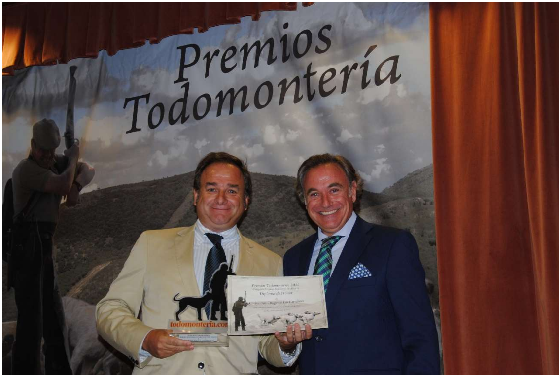
Carboneras: Diploma Honor Mejores Monterías en abierto T 2014-15