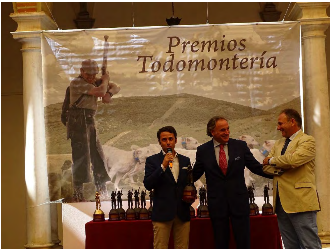
Carboneras: Mejores Monterías en abierto T 2017-2018