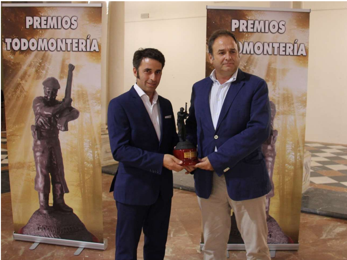
Aljabara Spínola: Mejores Monterías en Abierto T 2016-2017