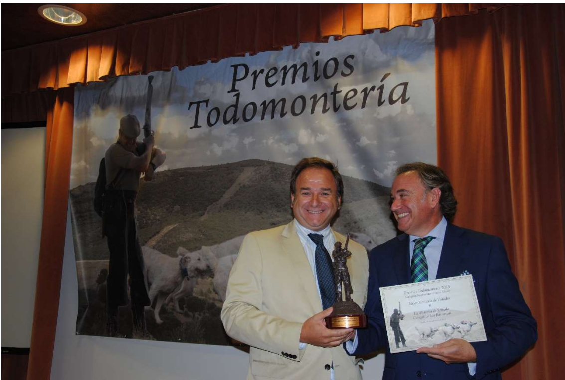
Aljabara Spínola: Mejor Montería de Venados en Abierto T 2014-2015