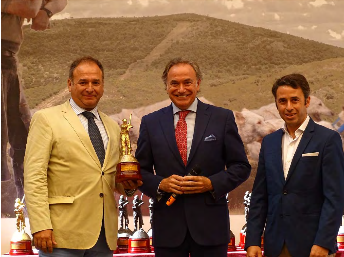
Aljabara Spínola: Montería Oro en Abierto. Montería del Año T 2017-2018.