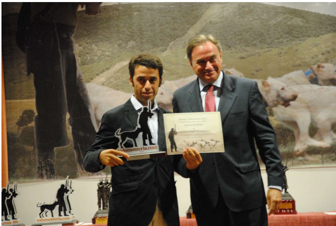
Carboneras: Diploma Honor Mejores Monterías en abierto T 2013-14