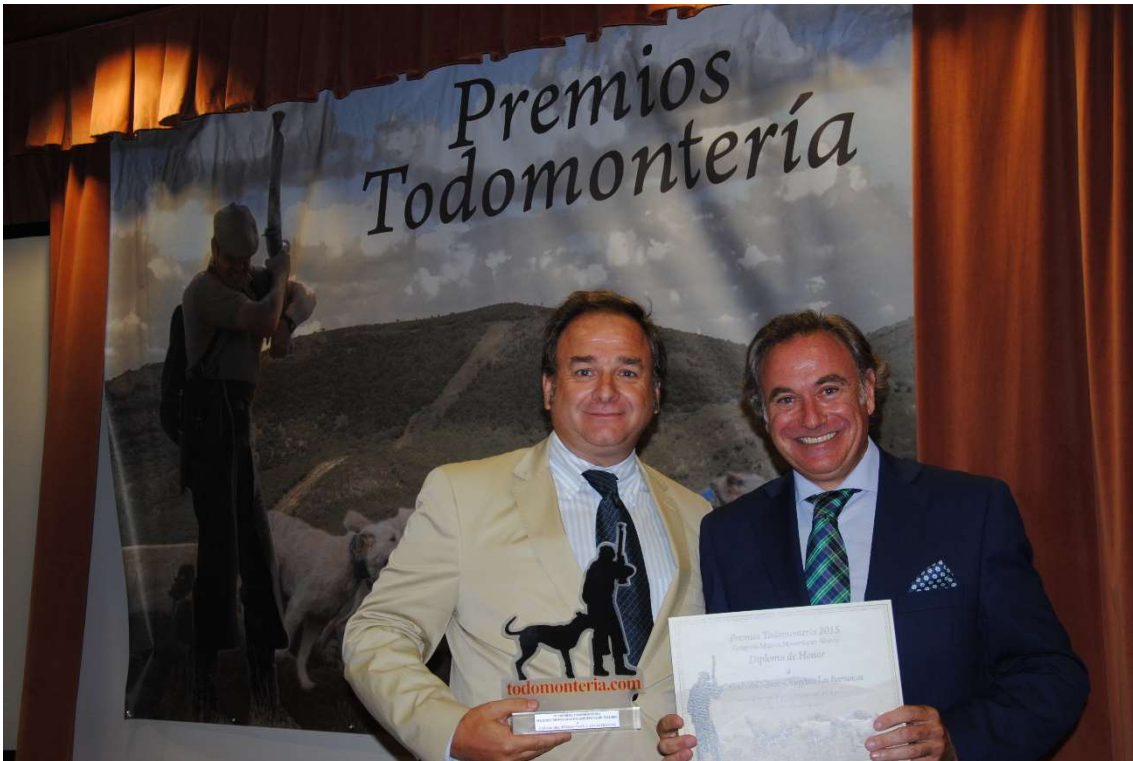
Cañada del Névalo: Diploma Honor Mejores Monterías en abierto T 2014-15