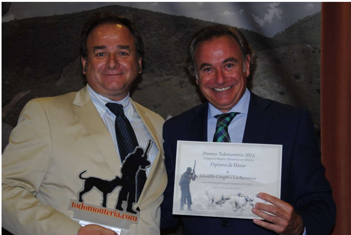
Jabardillo: Diploma Honor Mejores Monterías en abierto T 2014-15