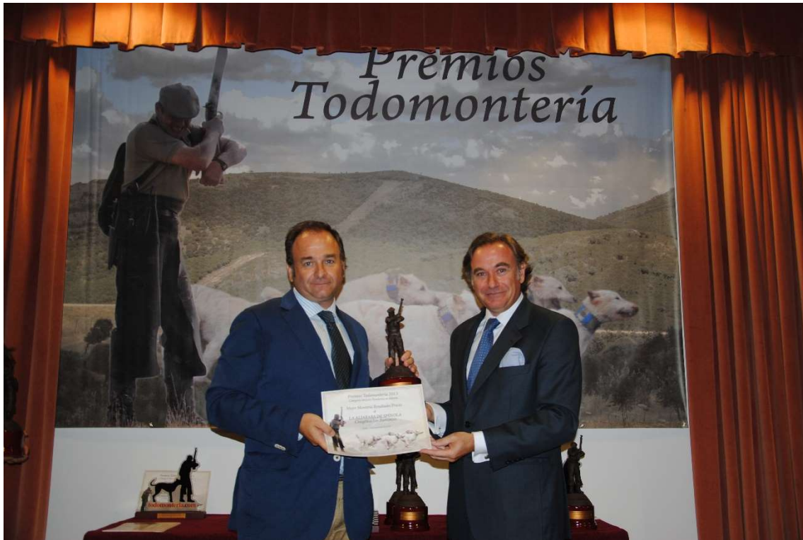
Aljabara Spínola: Mejor Montería en Abierto T 2012-2013